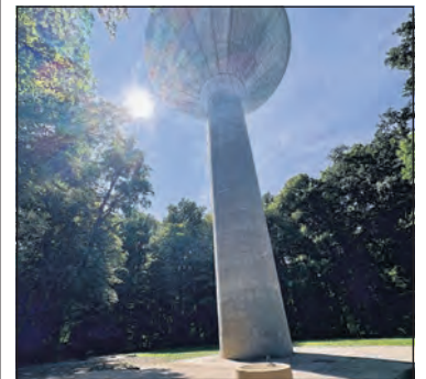
Anlass auf der Waldbühne beim Wasserturm.