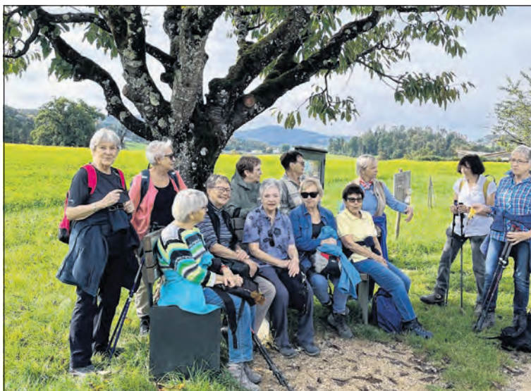
Der Club 23 genoss bei seinem Ausflug die schöne Landschaft, die imposanten Eichen und die Geselligkeit.