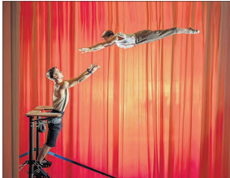
Das Jubiläumsprogramm des Circus Monti ist vom 21. August bis 1. September auf der Rosentalanlage zu sehen.

15 Künstlerinnen und Künstler begeistern einerseits in ihren Spezialdisziplinen wie Diabolo, Hand-auf-Hand, Hula-Hoop, Jonglage und Tellerjonglage, Kontorsion,