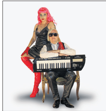
Nach 43 Jahren Bandgeschichte erstmals in der Schweiz: Trans-X freuen sich auf den Auftritt in Basel.

Hin und wieder geben auch die Stars von anno dazumal ein Stelldichein auf der «Formel 80»-Bühne. Am Samstag, 14. September, ist es wieder so weit: Trans-X geben erstmals in der Schweiz ein Konzert. Die 1981 gegründete kanadische Formation ist vor allem für ihren Hit «Living On Video» bekannt. Der Track aus dem Jahr