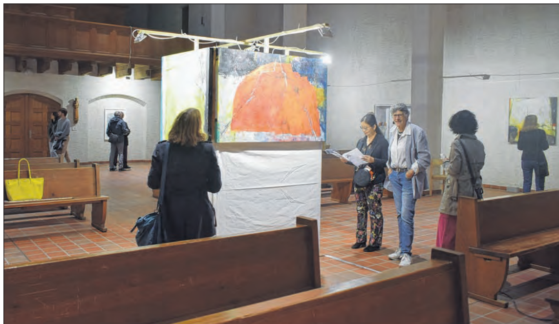
Im Hauptschiff versammelt die Ausstellung des Kulturvereins Malerei und Skulpturen sowie Wortbeiträge. Dieses Wochenende finden zudem noch Veranstaltungen statt.