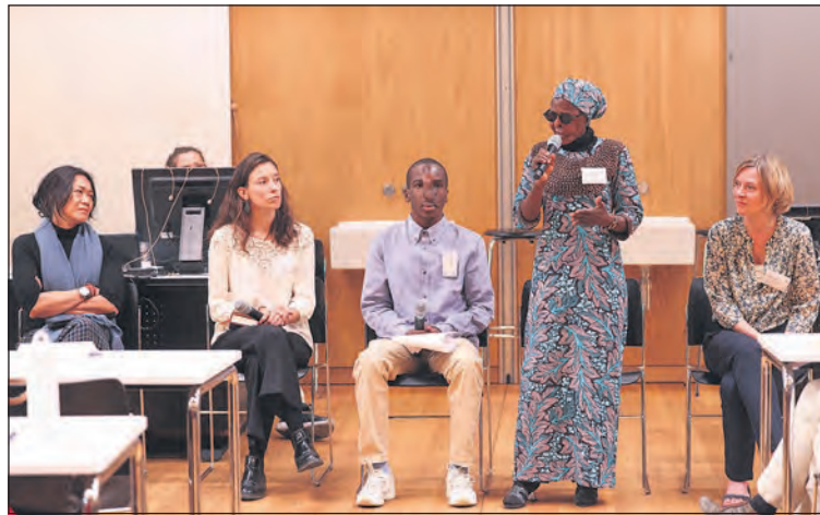
Das Symposium brachte Experten aus der ganzen Welt sowie Noma-Überlebende aus Nigeria und Mosambik zusammen.

Bis zu 90 Prozent der Betroffenen sterben an Noma, wenn sie nicht behandelt werden. Noch immer sind viele Aspekte von Noma unbekannt, vom genauen Verlauf der Krankheit bis hin zur Zahl der Betroffenen. Ende 2023 wurde Noma von der Weltgesundheitsorganisation (WHO) offiziell als vernachlässigte Tropenkrankheit (neglected tropical disease, NTD) anerkannt.