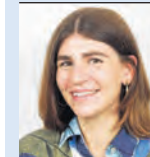
Von Ella Walch

Mit dem Beginn des neuen Semesters wird Allschwil wieder zum Daheim für Studierende aus der ganzen Welt. Am Schweizerischen Tropen- und Public Health-Institut (Swiss TPH) lernen sie nicht nur im Hörsaal oder Labor, sondern auch voneinander – ein lebendiger Austausch, der Allschwil zu einem globalen Treffpunkt macht.