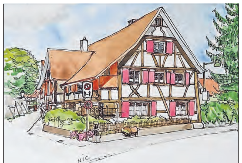
Die Ausstellung in der Galerie Monfregola in Riehen zeigt Bilder von Künstlerinnen, eine davon kommt aus Allschwil.