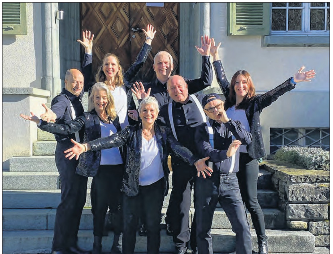
Die Sängerinnen und Sänger der Velvetunes sind am 18. September in Allschwil zu hören.