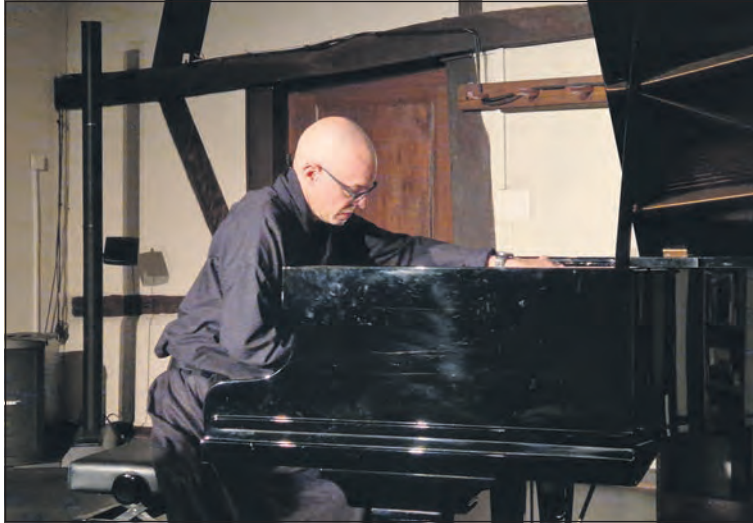
Die eine Hand auf den Tasten, die andere auf den Saiten: eine für Nik Bärtsch typische Spielhaltung.

Musizieren, ist für Nicht-Musiker aber ebenfalls interessant und auch verständlich. Bis jetzt ist es ausschliesslich auf Englisch erhältlich. Die Lesung auf Deutsch im Fachwerk war also eine kleine Premiere.