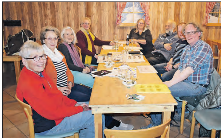
Am 6. März trafen sich einige der beteiligten Kulturschaffenden in der Remise des Landhus zur Planungssitzung.