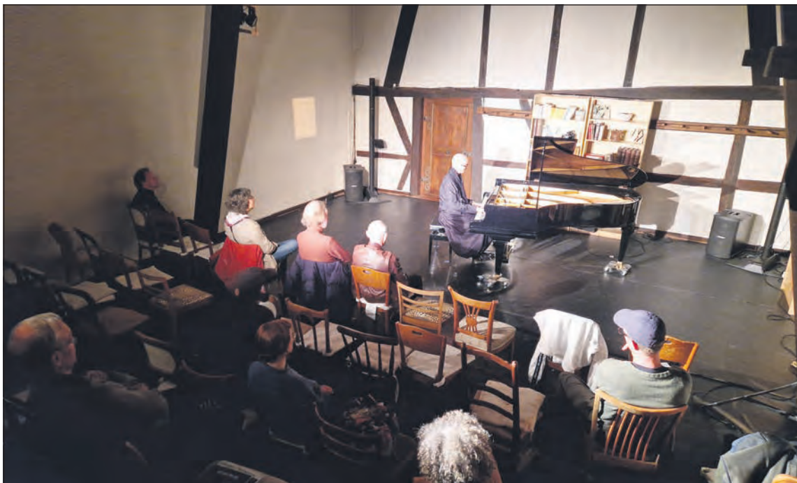
Eine kleine Runde war es, die sich am Donnerstag vergangener Woche im Fachwerk einfand.