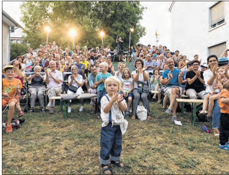
2018 fand zum ersten Mal eine Kulturwoche statt (im Bild). Heuer sind es Kulturtag vom 11. bis 27. September.