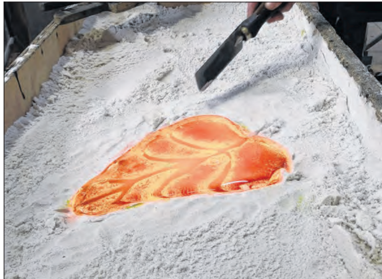
Ein Element eines Werks von Isabela Lleo bei der Entstehung. Es wird an der Ausstellung «Wandel» zu sehen sein.

Zum Mitbewegen lädt der Dorf Jazz als Auftakt ein, der Workshop indischer Tanz für Kinder und Junggebliebene zieht um den Wasserturm und in der Theresienkirche entsteht ein kollektives Werk. Die Vernissage zur Ausstellung «Wandel» am 11. September um 16 Uhr spannt einen Bogen zum Abschlusskonzert am Freitag, 27. September, im Saal