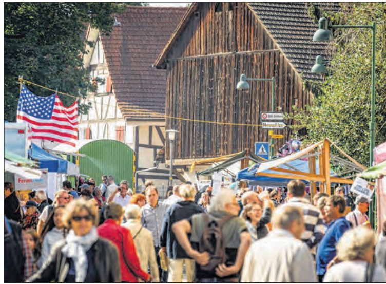
Der Herbstmarkt findet morgen im Dorfkern statt.

Hunger und Durst sollen am Markt auch kein Thema sein. Vom klassischen Märtklopfer an aufwärts gibt es ein reichhaltiges kulinarisches Angebot. Zum Beispiel Suppe, Crêpes, Hamburger, Hackfleischkuechli, Popcorn, Piadina oder Pizza. Es gibt auch an diesem Markt wieder zahlreiche Sitzgelegenheiten zur freien Benutzung vor. In der Pastetlistube im christ katholischen Saal an der Schönenbuchstrasse kann man aber auch überdacht essen. Für Familien, Kinder